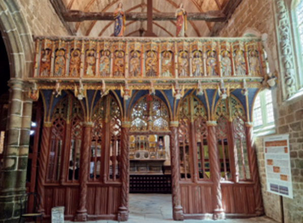
Chapelle ND de Kerfons