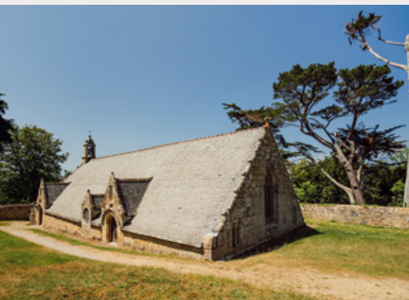
Chapelle ND de Port Blanc

Au cœur de la vallée du Léguer, à Ploubezre, Notre-Dame-de-Kerfons abrite depuis 1485 des bois polychromes, des statues gothiques et un admirable jubé, l'un des plus beaux de Bretagne. On reste bouche bée.