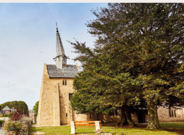
Chapelle Saint Gonery

Notre-Dame de Port Blanc , bâtie sur une tour de guet du XIII ème qui prévint, dit la légende, une invasion anglaise, semble à demi enterrée. Pourtant, la porte cloutée nous permet de découvrir cette émouvante chapelle de marins avec ses ex-votos, souvenirs de la pêche en Islande.