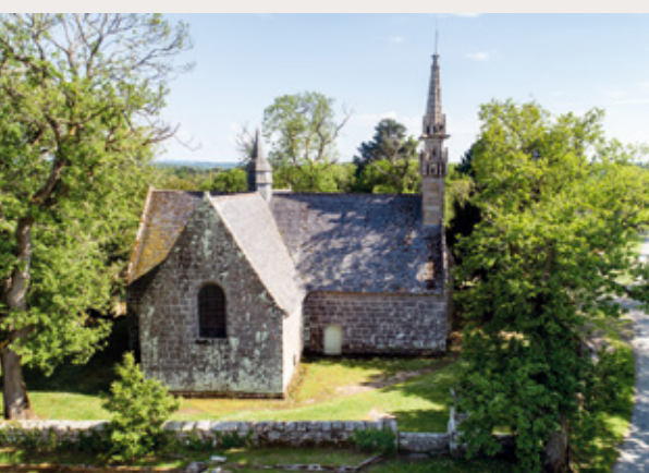
Chapelle des Sept-Saints

Au cœur de Plougrescant, la chapelle Saint-Gonery s'illustre d'un clocher penché bien mystérieux. La flèche de plomb aurait dévié lorsque la base de l'édifice s'est légèrement affaissée... Les siècles lui ont conservé cette coquetterie. A l'intérieur chatoient de superbes fresques murales du XV ème siècle, récemment restaurées. Saint-Gonery, moine britannique guérisseur de fièvres et d'angoisses, repose ici dans un reliquaire au pied d'un if séculaire, symbole d'éternité.