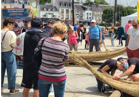
Week-end Navigation préhistorique

Les 18 et 19 juillet, sur le quai d'Aiguillon à Lannion, à l'occasion du « Léguer en fête », le Pays d'art et d'histoire proposera au public de voyager au cœur de la Préhistoire, à la découverte des premières navigations. Exposition, ateliers ludiques, jeux en autonomie autour des bateaux préhistoriques et chantier participatif de creusement de pyrogue en bois seront au programme.