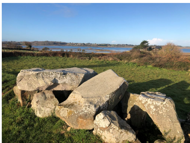
Kerbors Allée couverte de Men-ar-Rompét

En écho à la reconnaissance de la valeur universelle exceptionnelle des Mégalithes de Carnac et des Rives du Morbihan, Lannion-Trégor Communauté a souhaité embarquer le public dans le sillage des femmes et des hommes du Néolithique en Trégor (5000-2500 avant notre ère). Présentée à partir du 13 juin à Kerbors, puis à Lanmodez du 1 er septembre au 31 octobre, l'exposition « Mégalithes du Trégor. Quand les pierres racontent la Préhistoire » constitue