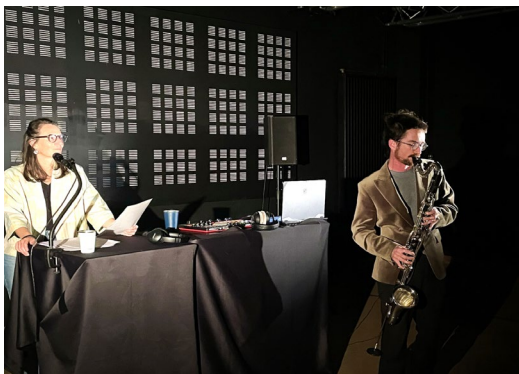
Spectacle Histoires d'ici

Émouvants, rythmés, décalés... tels sont les mots qui résument le mieux l'esprit des spectacles proposés cette année.