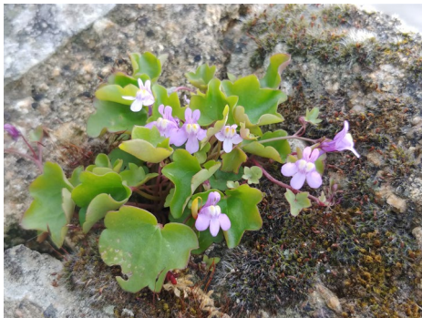
La nature dans la Cité

LANNION-TRÉGOR COMMUNAUTÉ LANNUON-TREGER KUMUNIEZH