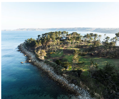
Parc départemental du Douven

Le 21 mai, à l'occasion de la Journée mondiale de la Biodiversité, les agents de la Direction de l'Environnement et du Pays d'art et d'histoire vous proposeront une découverte inédite du patrimoine architectural de Tréguier à travers la découverte de la flore et de la faune hébergée au coeur de l'ancienne cité épiscopale.